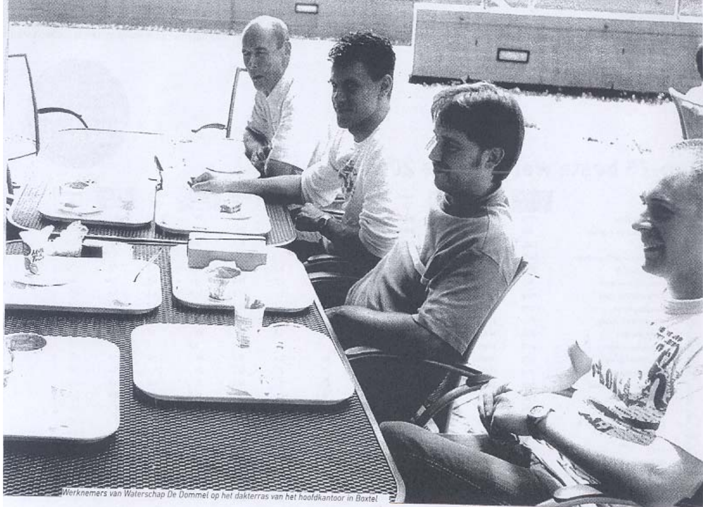
Werknemers van Waterschap De Dommel op het dakterras van het hoofdkantoor in Boxtel

Wie zijn de beste werkgevers in de non-profit 2005?